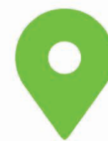
ZI Saint Eloi