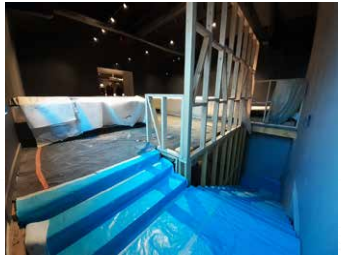
Musée Mode et Textiles