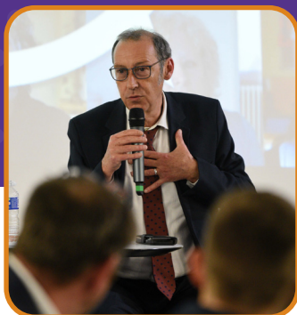
LE MOT DE FABIEN BAZIN PRÉSIDENT DU CONSEIL DÉPARTEMENTAL DE LA NIÈVRE

PRÉSENTATION DU DÉPARTEMENT À L'OCCASION DE LA RESTITUTION DE LA DÉMARCHE À L'ÉTANG DU MERLE, LE 25 JUIN 2022 À 19H